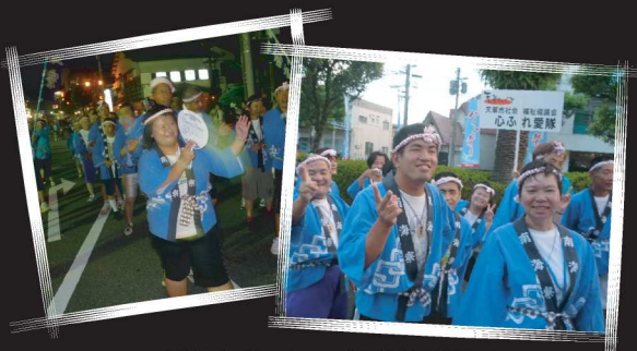
盛り上がったハイヤ道中総踊り

沿道には沢山のお客さんで、始まる前は、皆さん緊張した表情でしたが、いざ踊り始めると、表情も和らぎ笑顔へと変わっていました。沿道から「がんばれ！南海寮！」「○○さん」などと温かい声援を受けるとますます踊りや掛け声にも力が入って、楽しく踊っていた様子でした。