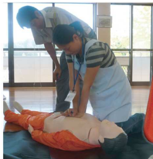
AEDを使用した救急法研修

署(救急救命士)から緊急時の対応とAEDの使用方法を教わっております。いつ、何処で緊急事態(倒れて意識もなく呼吸をしていない)が起こるかもしれません。救急車が到着するまで救命の処置、またAEDの電源を入れておくことで、心電図が記録され、医師にも正確な情報を提供、早期診断と治療が受けることが出来ます。緊急時に「AEDを持って来て