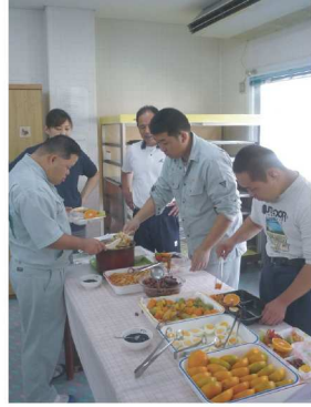
仲良くお弁当をレイアウト 通所部の皆さん