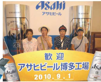
本場のビールを堪能 (アサヒビール博多工場)