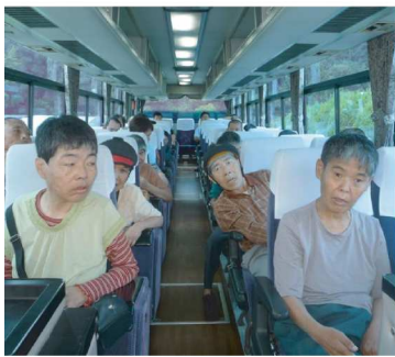
バスに乗って出発進行～！

その後、ホテルアレグリアに到着し昼食をとりました。刺身にハンバーグ、茶碗蒸しなど、種類も多く、お腹一杯になり満足され、楽しい食事できました。