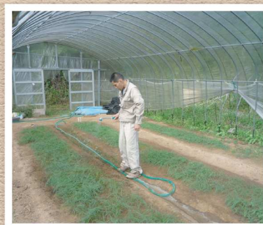
ハウス内の玉ネギ苗に念入りに灌水

売していますが、今年は暑い日が続いたことなどで、例年になく不作でした。しかし、そんな暑い中にも作業班の利用者が毎日頑張られたおかげで、今年も販売することができました。100本350円です。よろしくお願ひします。また、花苗も金魚草(赤、白、黄色、ピンク)とパンジーの苗を仕立てましたので、お知らせします。