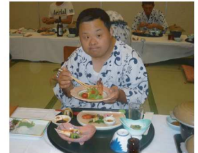
絶品懐石料理 濱さん(指宿)