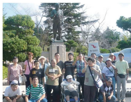
歴史を知る旅。知覧特攻平和会館(鹿児島)

9月15・16日で鹿児島へ、一泊旅行へ行ってきました。1日目はあいにくの雨天でしたが、元気に出発進行!!八代から新幹線「つばめ」に乗