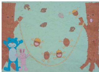
森の熊とうさぎがどんぐりと楽しく縄跳びしています

平成22年9月7日、南海寮にAED(自動体外式除細動器)が設置されました。2004年7月厚生労働省が非医療従事者のAED使用を認める見解を出しました。従って、一般の方がAEDを使用しても問題ありません。施設内研修として、毎年消防