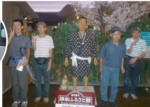
西郷隆盛生誕の地で西郷さんフィギアと記念写真 (維新ふるさと館)