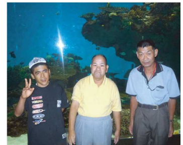
海の生き物達に感動 (いおワールドかごしま水族館)