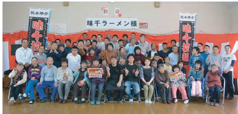
重光産業株式会社スタッフ、味千ラーメン帯北店スタッフの方と記念撮影