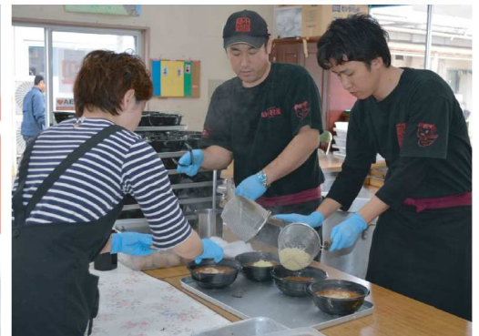
ご協力いただいたスタッフの皆様ありがとうございました