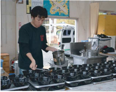
全130食分を無料で提供

今回も利用者の皆さんの目の前に特設の調理場を設けて頂き調理開始。スタッフの流れるような手捌きにより、豚骨スープ