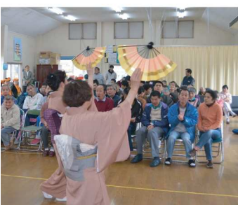
楽しくも真剣に見入る利用者の皆さん(日本舞踊)