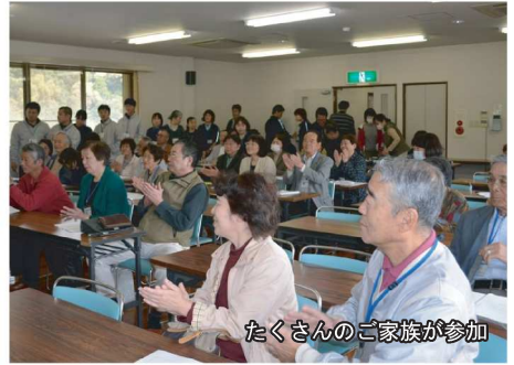
たくさんのご家族が参加