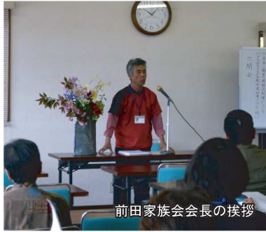
前田家族会会長の挨拶

年度変わりのご多忙の中、ご協力頂いたご家族の皆様、本当にありがとうございました。