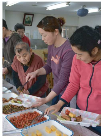
バイキング！自分だけのオリジナル弁当